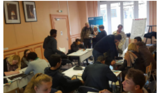
Le matin: avec une classe de lycéens de terminale du Lycée Jean Rostand et leurs professeurs