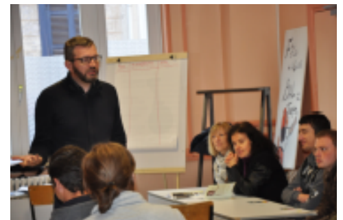
L'après midi, une classe de 6° du Collège JB Lebas, avec leurs professeurs