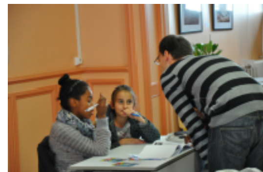
Lecture des textes au groupe