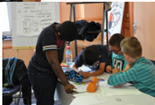
Ecriture des contes